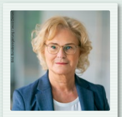
Christine Lambrecht, Bundesministerin für Familie, Senioren, Frauen und Jugend

Alle Sammelstellen finden Sie unter www.Kinderzukunft.de